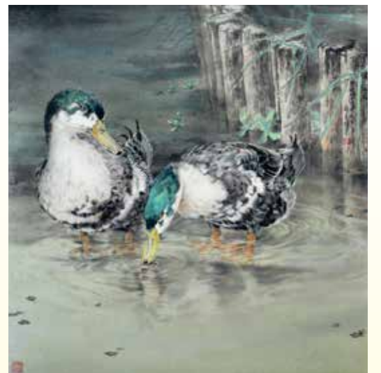
碧波雙鴨圖 / 2016 70×68cm 水墨、紙本