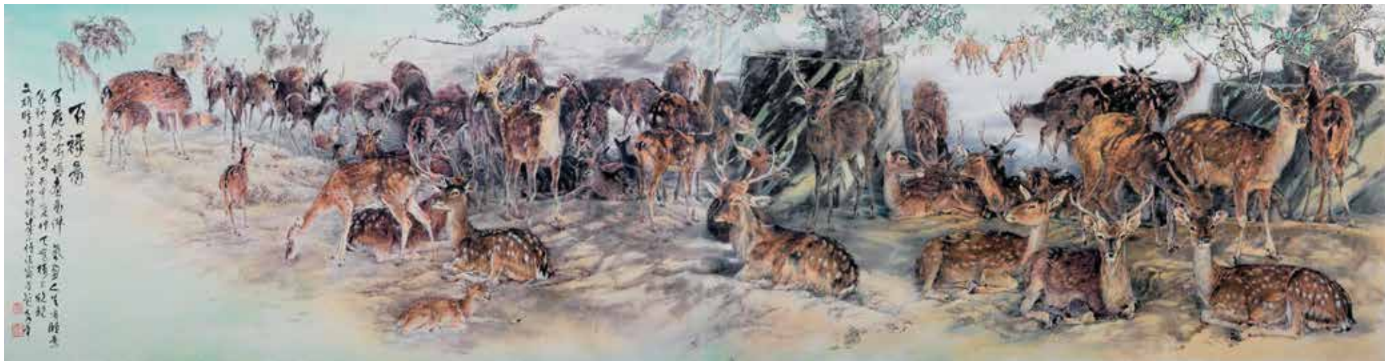
百禄图 2016 476×122cm 水墨、纸本