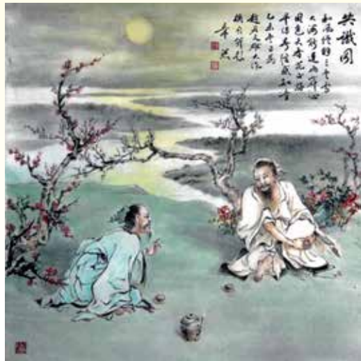
共識圖 / 2015 68×66cm 水墨、紙本

趙文雄認為，創作應從華人文化出發，其中筆墨趣味所蘊含的藝術感是東方文化不可或缺的特色，藝術家有傳承文化精粹的使命感，將之好好發揚光大。因此，趙文雄雖然是由西方繪畫入門，但在師承多方的背景之下，選擇以水墨作為主要的創作發展方向，水墨創作因此具有東西合璧的風格。透過扎實的西方及東方繪畫基礎，結合兩者於創作之