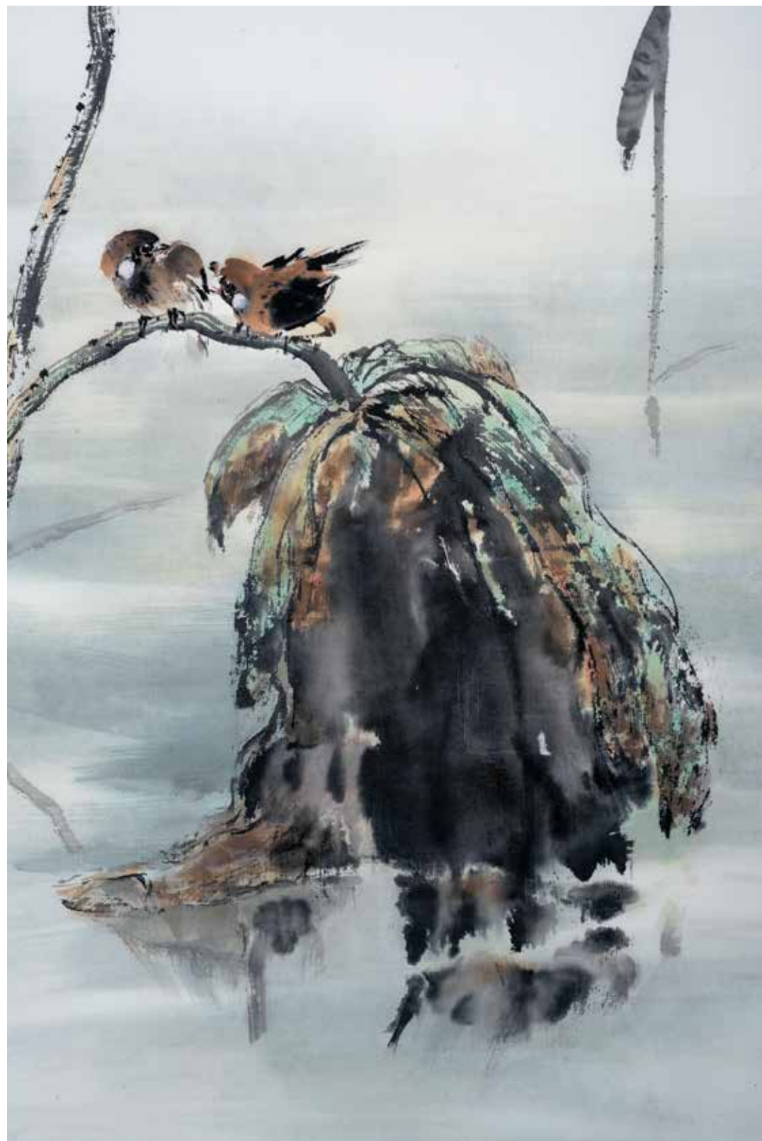
雙雀荷影 2016 69×34.5cm 水墨、紙本