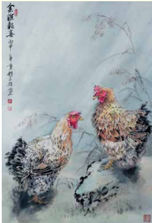
金雞報喜 / 2016 68×46cm 水墨、紙本