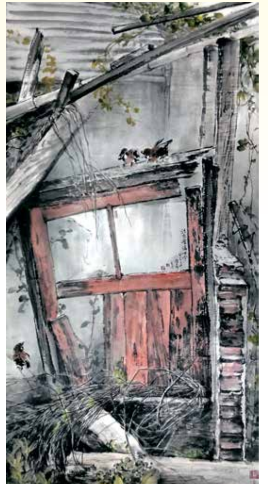
話家常論古今 / 2014 136×69cm 水墨、紙本