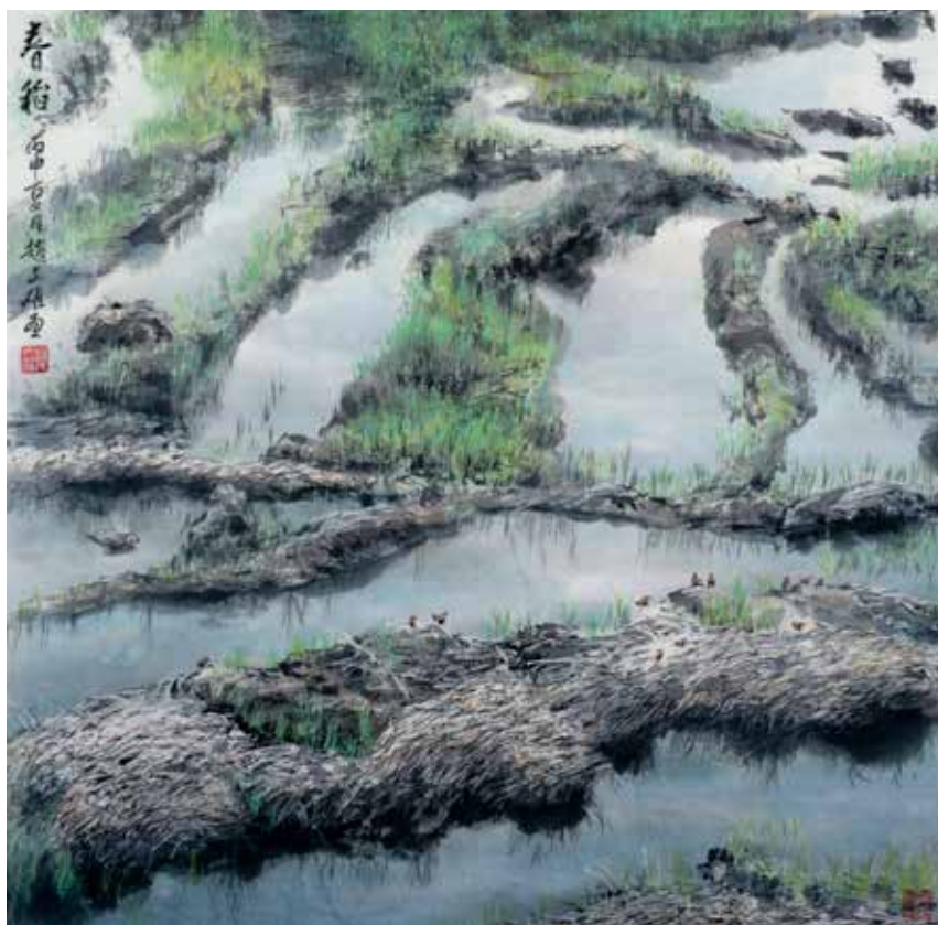
春稻 2016 67.5×69cm 水墨、纸本