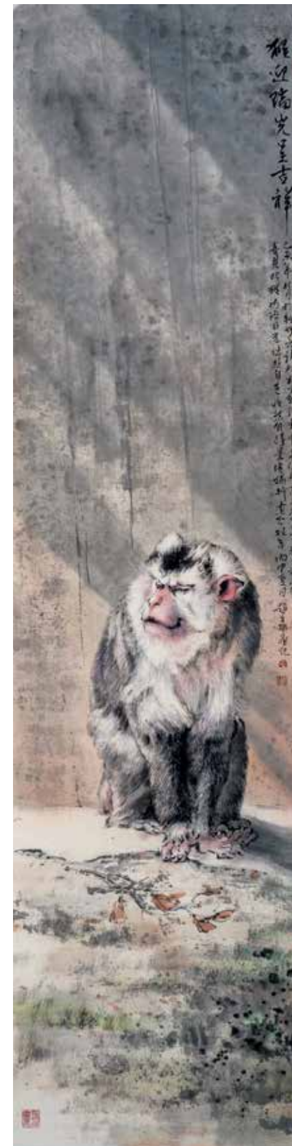
猴迎瑞光呈吉祥 2016 138×34.5cm 水墨、纸本